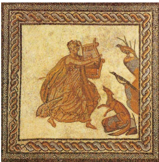
Il canto d'Orfeo, mosaico, I sec. d.C. (Musée Granet, Aix-en-Provence)

reazione all'opera seria all'italiana di soggetto storico e su libretti di Metastasio che è basata su recitativi ed arie di bravura o cantabili, sul virtuosismo di castrati e soprani e sul canto idealizzato: ira, lamento o trionfo. Di fatto, però, la Riforma di Gluck & Compagni è circoscritta nel tempo (gli anni Sessanta) e nello spazio (Vienna). Quando il direttore dei teatri viennesi, marchese Giacomo Durazzo, non gode più dei favori della corte anche il cosiddetto teatro riformato finisce. Torna prepotente in scena, al suo posto, quel melodramma che ha circolazione internazionale, parla immancabilmente italiano e si basa sul primato dei cantanti. Lo stesso Gluck è un eclettico seppure eclettico-intellettuale in-