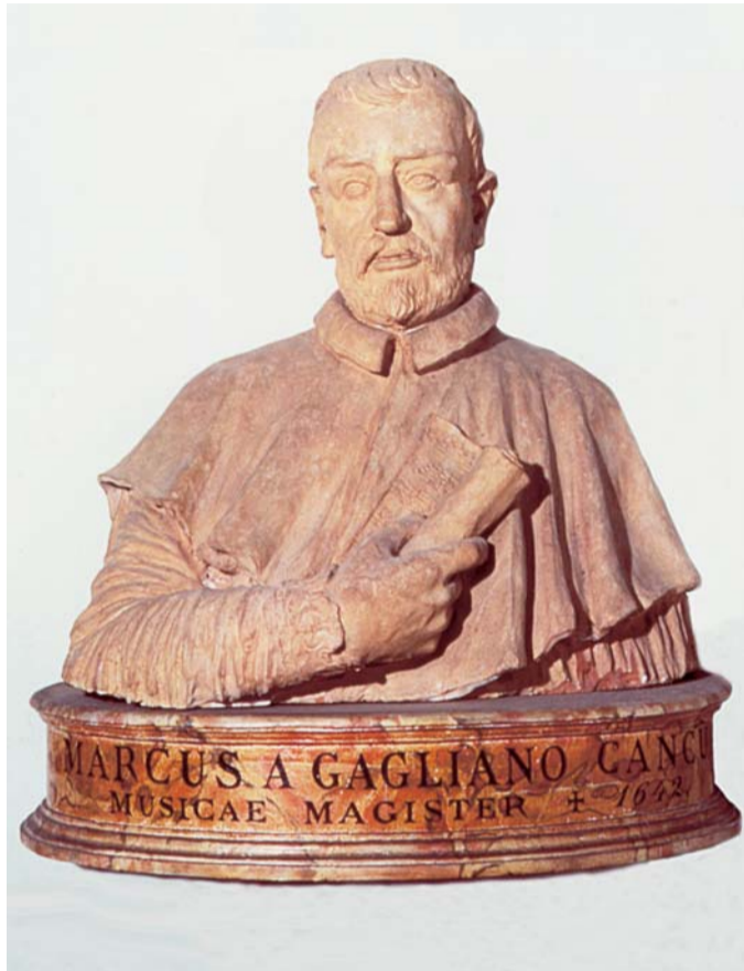
Busto di Marco da Gagliano (Sala Capitolare della Basilica di S. Lorenzo, Firenze)

E con questo il cerchio si chiude, dal momento che ritorniamo in quel di Mantova da dove eravamo partiti e dove il fiorentino si trovò a collaborare con il concittadino e confratello Rinuccini (il famoso librettista della Dafne perduta musicata da Peri nel 1598, nonché delle famose Euridici di Peri e Caccini) per scrivere il testo