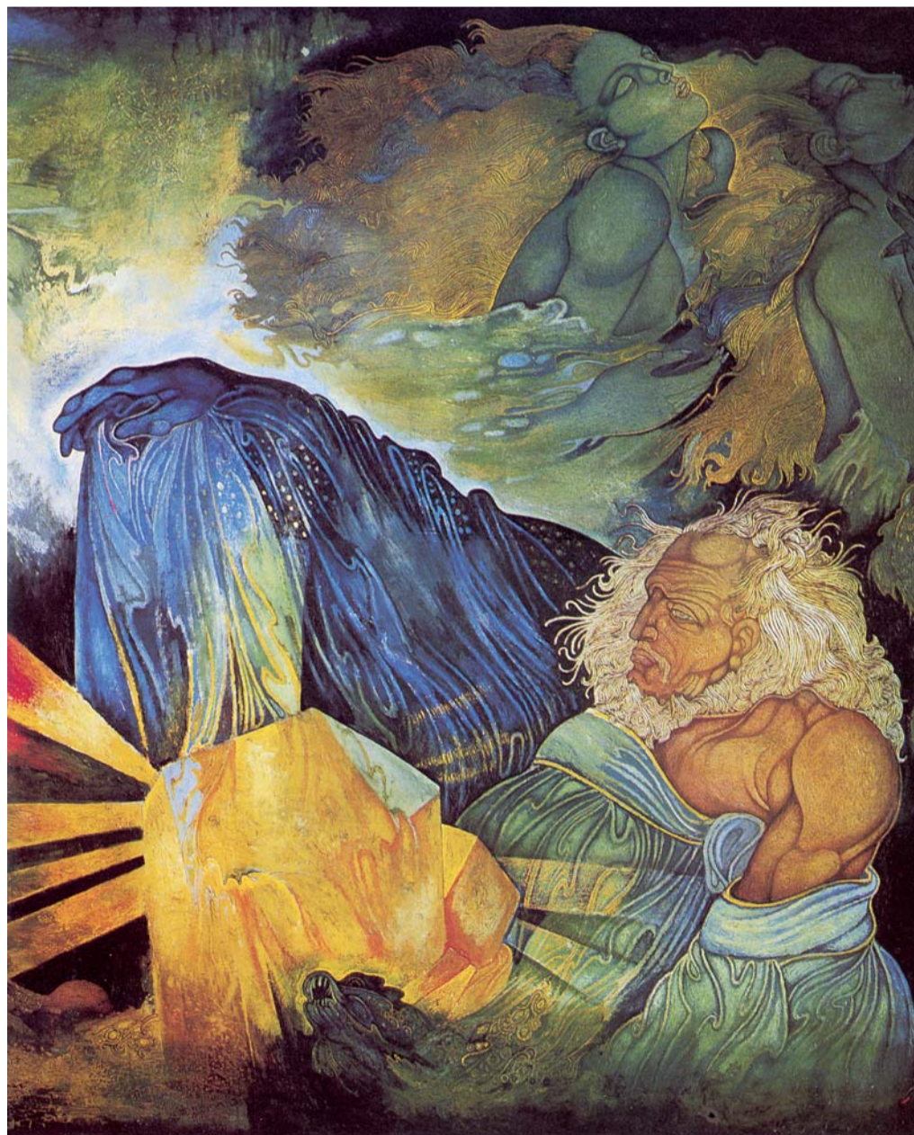
Giuliano Pini, L'Oro del Reno , olio su tavola (particolare)