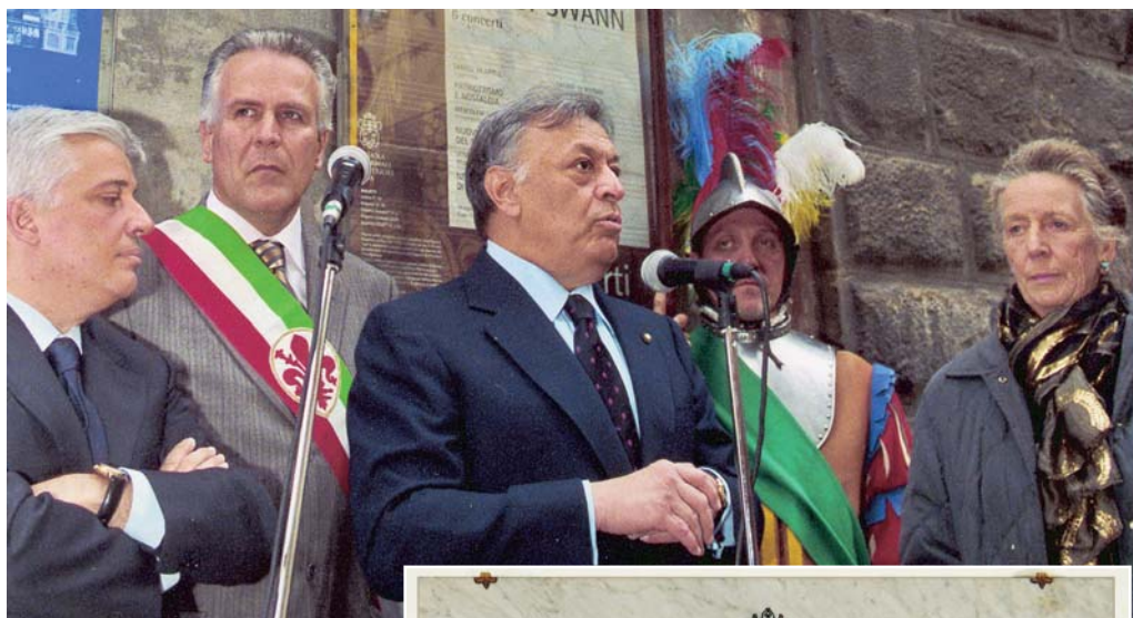
Firenze, piazza dell'Olio 30 Aprile 2006 Un momento della cerimonia per la posa della targa in ricordo del soggiorno fiorentino di Mozart nel 1770

Sempre per stimolare l'interesse per i programmi del teatro la nostra Associazione organizza cicli di conferenze per ricostruire il contesto letterario, artistico e storico legato alla musica. Questo programma che si svolge in diverse incontri è denominato «Convergenze: Arte, Musica, Storia e Letteratura». Le presentazioni, sempre affidate a grandi personalità del mondo della cultura, sono state ospitate in luoghi di importanza eccezionale come alcuni musei fiorentini (Stibbert, Argenti, Arte Moderna, Marino Marini, Archeologico) o istituzioni culturali (Istituto Francese, British Institute) allo scopo di inserire l'attività del Teatro nel tessuto culturale della città.