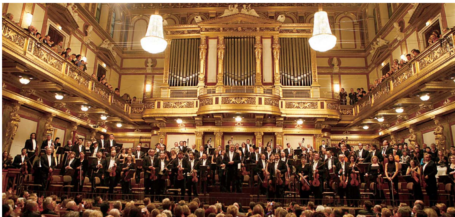
L'Orchestra del Maggio Musicale Fiorentino e Zubin Mehta al Musikverein di Vienna (tournée, Novembre 2007)

Ripensando con affetto e gratitudine a tutto questo, vi mando un augurio di cuore per tutte le prossime iniziative che ci vedranno lavorare insieme a costruire il futuro del nostro Teatro.