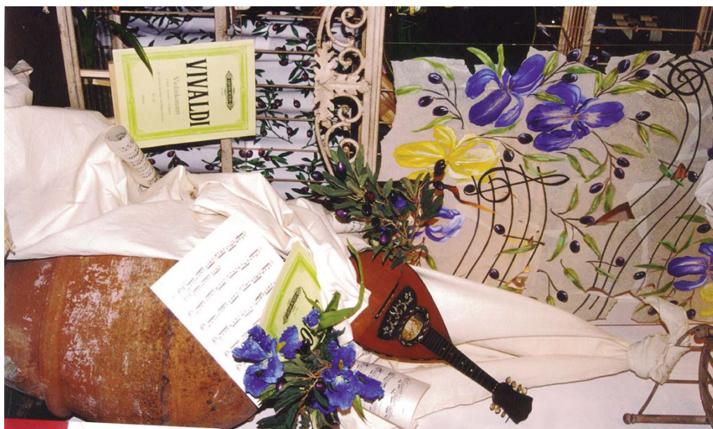
La bottega dell'olio, Premio «Per la vetrina musicalmente più fantasiosa» («Il Maggio in vetrina» 2001)

studio abbiamo cercato di affrontare i problemi legati alle sponsorizzazioni degli enti teatrali. Durante un primo convegno ospitato nell'Auditorium della Camera di Commercio nell'Ottobre 2004, i relatori hanno sviluppato il tema «Comunicare con il Teatro del Maggio: prospettive di investimento in cultura per le imprese». Particolare interesse ha suscitato l'intervento della direttrice del dipartimento di sviluppo e Fund Raising del Covent Garden di Londra, Ruth Jarratt, che ha illustrato quanto le attività che mirano ad avvicinare il pubblico al Teatro fossero di primaria importanza e l'utilità degli Amici del Teatro, che a Londra lavorano in stretto contatto con i funzionari del Covent Garden nella realizzazione delle iniziative rivolte ai suoi sostenitori. Per una seconda giornata di lavoro, organizzata due anni dopo e svoltasi nel Piccolo Teatro del Maggio, abbiamo lavorato in collaborazione con l'Ordine dei commercialisti, dei ragionieri e dei notai. In questa occasione sono state messe a fuoco chiaramente le disposizioni di legge e gli eventuali vantaggi fiscali che riguardano le donazioni da parte di singoli o di aziende a sostegno dell'attività di un ente lirico. Nuovi interventi legislativi hanno negli ultimi anni agevolato gli eventuali donatori; si spera tuttavia in ulteriori provvedimenti per estendere ai privati vantaggi per ora riservati alle aziende.