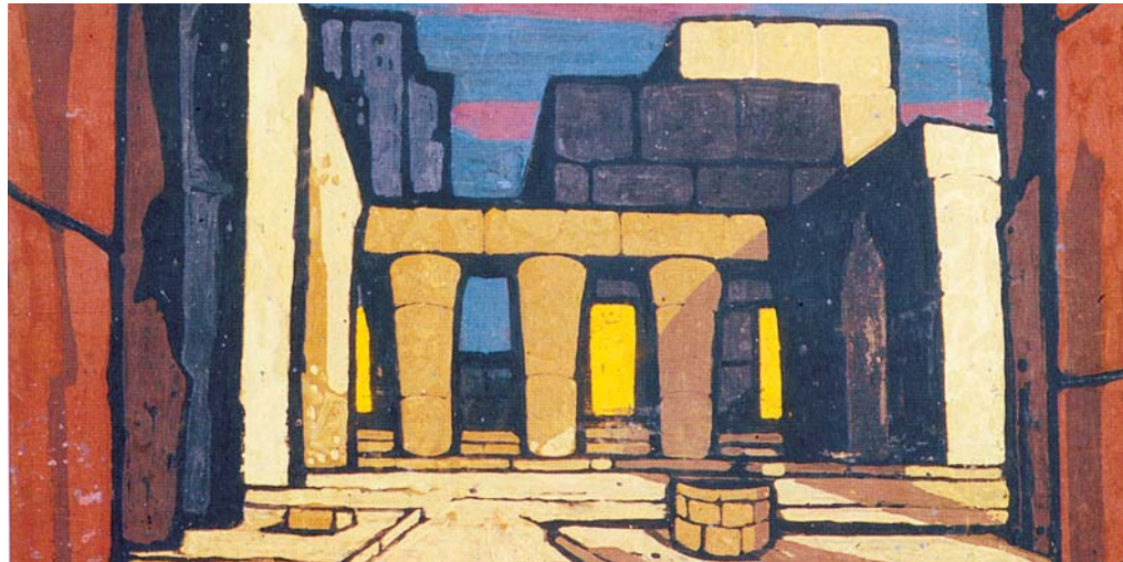
Felice Casorati, bozzetto di scena per Elektra di Richard Strauss (XIII Maggio Musicale Fiorentino 1950)

A impressionare Strauss era stato soprattutto il fatto che Hofmannsthal, figlio assai colto del suo tempo, aveva imbevuto di crudeltà sanguinarie, di urla e di ossessioni, di morbosità perverse degne del lettino di Freud la nota vicenda sofoclea, dallo scrittore esaltata nei suoi aspetti più bestialmente umani, nelle sue passioni più atroci e spinte fino al limite. A Micene, le truci vicissitudi-